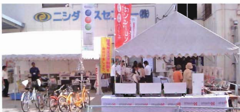
(←) お車以外に自転車でも多数ご来場いただきました!