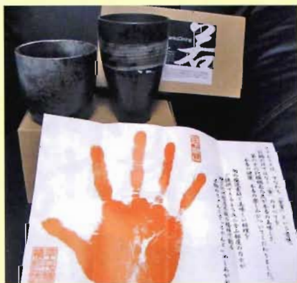
泡旨ビール(直径8cm×高さ128cm) 焼酎カップ(直径98cm×高さ98cm)